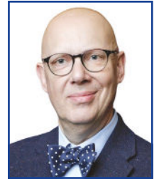
T. DESMETTRE Centre de rétine médicale, MARQUETTE-LEZ-LILLE.