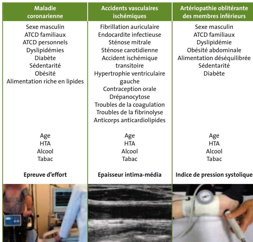
TABEAU II : Le dépistage des atteintes vasculaires infraclinique par l'indice de pression systolique (Doppler), la mesure de l'épaisseur intima-média carotidienne (écho-Doppler) et l'épreuve d'effort.

Le dépistage de l'atteinte cardio-vasculaire infraclinique pourrait permettre de mieux positionner l'importance du contrôle de la maladie ( tableau II ). S'il est évident qu'obtenir la rémission de la PR est impor-