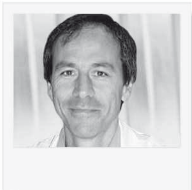
→ A. SARAUX 1 , F. GUEGUEN 2 , S. JOUSSE 1,2 , L. BRESSOLLETTE 1

RÉSUMÉ : La polyarthrite rhumatoïde est associée à une augmentation de la mortalité coronaire et cérébrovasculaire. Ce risque est lié à la fois aux facteurs de risque cardiovasculaire traditionnels, dont certains sont plus fréquemment observés au cours de la PR, et à des facteurs spécifiques des pathologies inflammatoires chroniques. L'EULAR a proposé 10 recommandations pour diminuer ce risque, et notamment de limiter au maximum l'inflammation biologique, d'évaluer chaque année le risque cardiovasculaire, de donner des conseils d'hygiène de vie, de discuter l'intérêt d'un traitement par statine et antihypertenseurs dès lors que le risque cardiovasculaire est augmenté. Le meilleur moyen de dépister l'atteinte cardiovasculaire infraclinique à l'échelon individuel n'est pas actuellement défini.